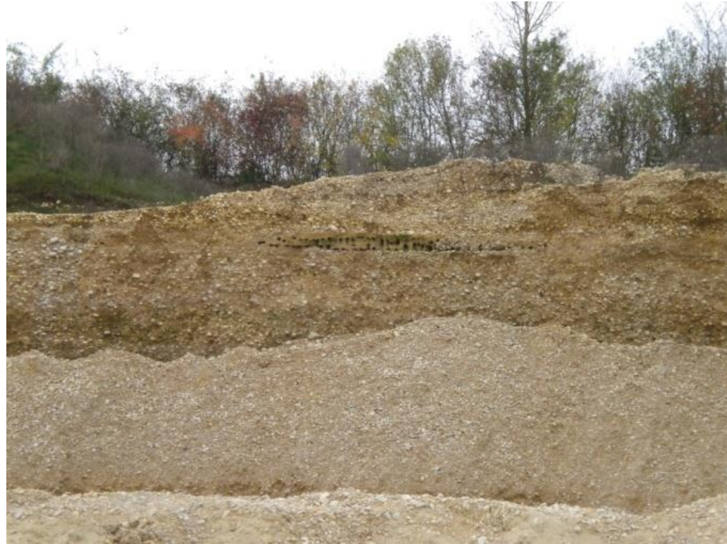
Hirondelles de rivage